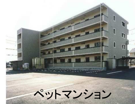
ペットマンション