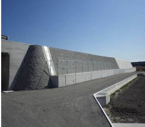
大井川焼津藤枝SIC(上り線)