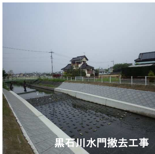
黒石川水門撤去工事